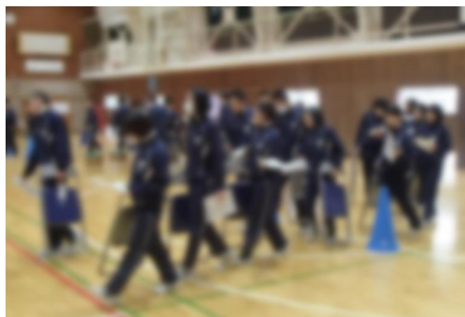
新幹線の乗車練習の様子。長岡駅や新大阪駅では1分間での乗車・下車です。