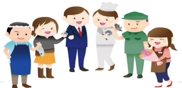
職場見学事業所アンケート