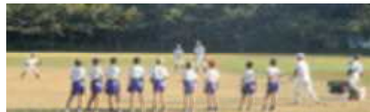
2年生、とっても頑張りました。来年が楽しみです