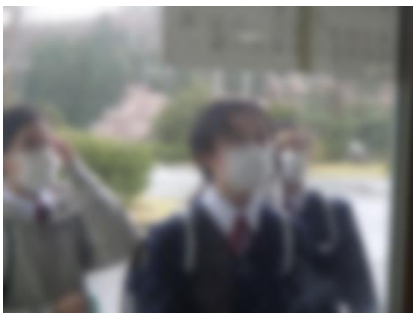
自分の名前を探しています。