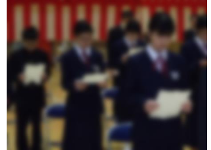
校歌の練習をする様子

さて、この「1学年だより」は、学年の出来事を中心に、学校と家庭を結ぶ様々な情報を掲載し、原則として週末に発行します。是非、親子で読んでください！