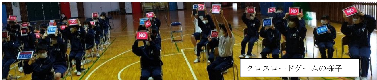
クロスロードゲームの様子

(振り返りプリントより) 津波は自分たちが思っているより、怖いということが分かりました。もし津波がきたらすぐ避難しようと思いました。防災教育プログラムを通して、このような大切なことを学ぶことができました。(男子)