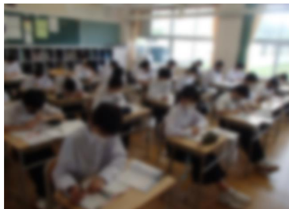
テスト直前は、朝読書の時間に、学習します。全員真剣に取り組んでいました。

今回の取組とテストの結果をしっかりと振り返り、学習時間のバランスや方法を改善し、学習に対する自信をつけていってほしいと思います。