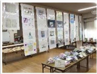
【あずま袋】手ぬぐいを使った、昔ながらのショッピングバッグ

9日(火)～12日(金)の期間、2学期保護者面談、生徒作品展示を行いました。ご多忙の中、保護者面談にお越しいただき、また、生徒作品展示をご覧いただき、ありがとうございました。短い時間ではありましたが、生徒たちの学校での様子と、ご家庭での様子を確認し合うことができました。この気付きを糧に、生徒一人ひとりが輝けるよう、全職員でサポートしてまいります。今後とも温かいご支援をよろしくお願いいたします。また、生徒たちの努力の結晶である作品展示にも足を運んでいただき、生徒たちは、自分の作品を見ていただけたことを喜んでいると思います。皆様からのご感想や励ましが、今後の学習意欲につながると思いますので、ぜひ、ご家庭で話題に上げていただけるとありがたいです。