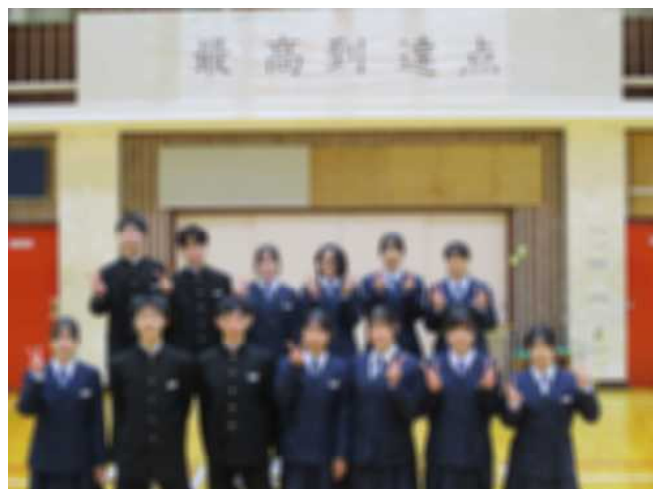
令和7年度生徒会本部役員・専門委員長

今年度の生徒会活動を総括する生徒総会が行われました。スローガンである「最高到達点」を目指し、いろいろな活動にチャレンジした結果、たくさんの成果が得られました。3年生の皆さん、ありがとうございました。また、1, 2年生の皆さん、先輩からのバトンを引き継ぎ、さらによい出中になるようにがんばりましょう。皆さんの活躍を期待しています。