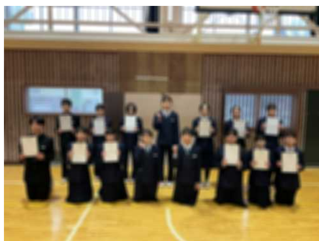
令和8年度生徒会本部役員・専門委員長